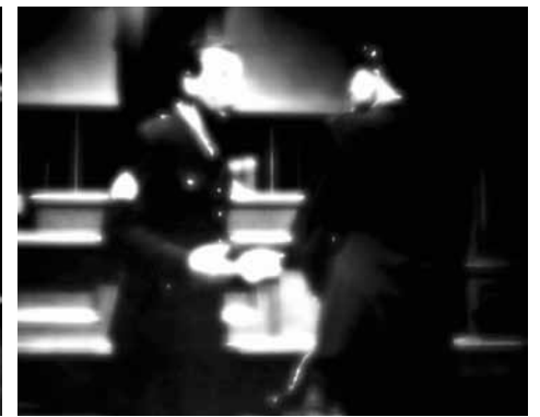
extraits de la vidéo le cauchemar n'est pas encore fini , 2010. Durée : 14 min