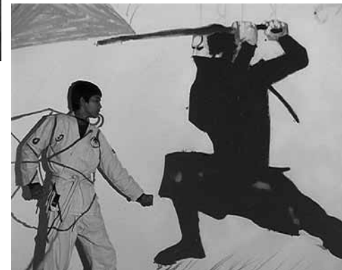
Extraits de la vidéo « Collège Liberté ! », 2010. Durée : 10 min