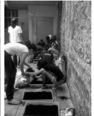
Images prises durant l'atelier