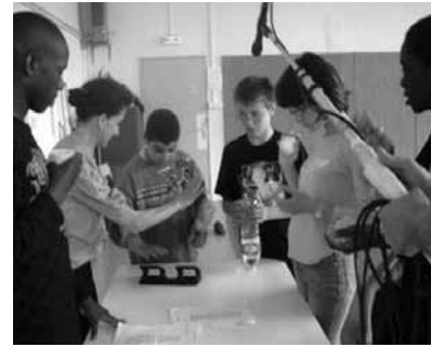
□□□ Entre gestes et son. Travail musical avec table et instrument de tout genre